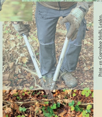
Print- en Copyshop MoBi, Leiden.